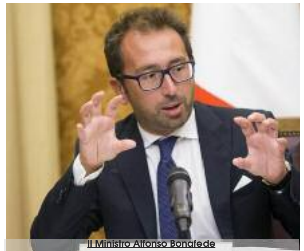
Il Ministro Alfonso Bonafede

chiesto dalla difesa e dal cittadino presunto innocente (sì, proprio lui: l'imputato!) ferma la clessidra del riposo.