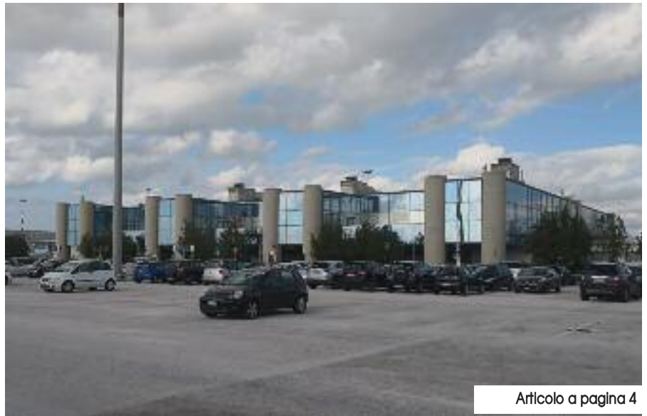
Articolo a pagina 4